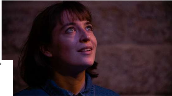
octobre 2022 Culture

On se demande comment un si grand talent peut tenir dans un si petit théâtre ? Il n'y a que 45 places à la Comédie des 3 Bornes et Merci pour la lumière ne s'y joue que le mercredi. Ce qui veut dire que vous n'avez que quelques chances d'assister à ce si brillant spectacle. Alors dépêchez-vous !