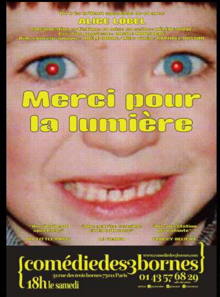
Nouvelle affiche, septembre 2023

Le fond ne pouvant se détacher de la forme, une salle de 20 à 200 places reste le format le plus adéquat pour narrer cette histoire et rester proche du public. Spectacle intimiste et confidentiel, nous cherchons également une atmosphère humaine et rassurante invitant à la confession d'histoires personnelles. Parole contemporaine et générationnelle relatant un parcours de femme, nous souhaiterions collaborer avec une scène inclusive, préoccupée par des problématiques sociales.