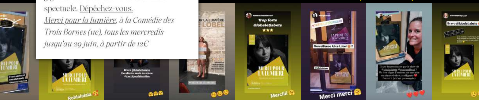
“Merci pour la lumière” sur instagram, oct. 2021

Après une pause estivale il sera de retour à la Comédie des 3 Bornes en septembre 2023, cette fois tous les samedis à 18h ! Nouvelle affiche, nouvelle tenue... et nouveau souffle sont au programme.