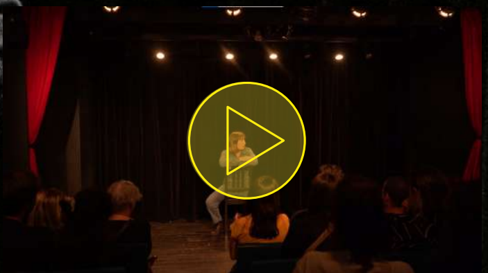
L'anti-teaser du spectacle, juin 2022

→ Captation du 30 mai 2023 disponible sur demande